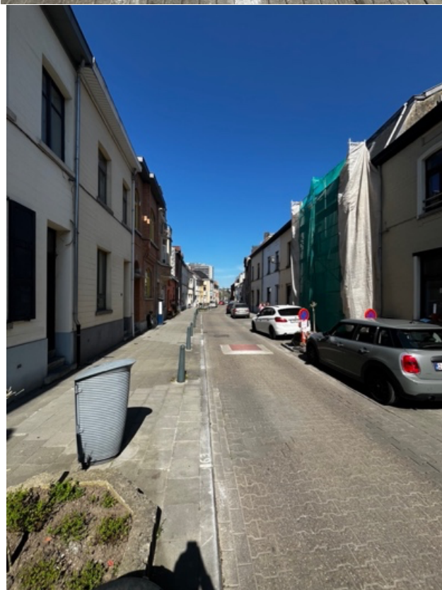
Photo 01 : vue du bâtiment depuis de la rue Photo 02 : Façade bâtiment en face Photo 03 : Vue de la rue vers le Shopping