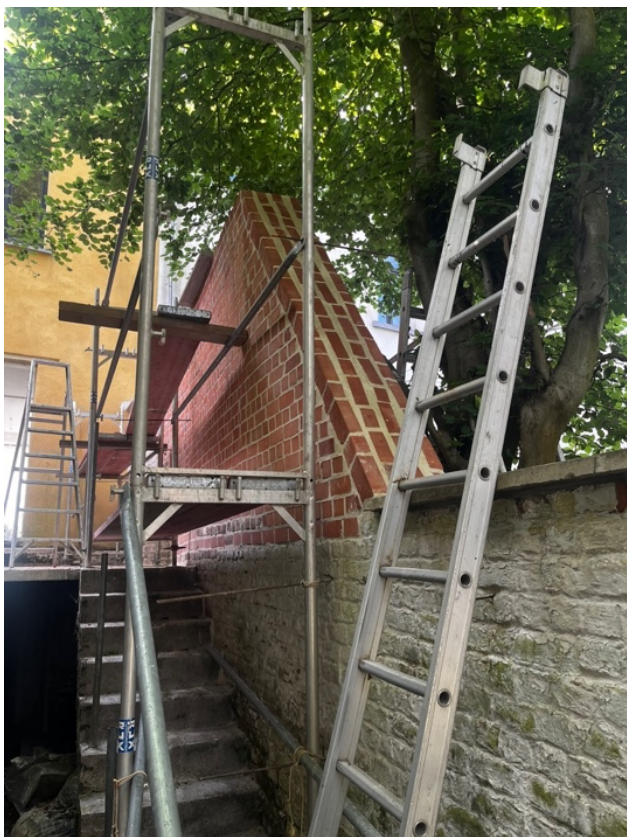
Photo 17 : Mur mitoyen réhaussé par les services communaux avant la vente